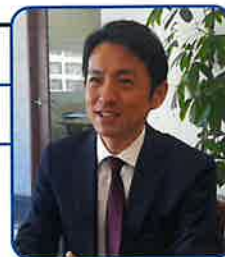
キャリアバンク株式会社 海外事業部 部長

行政書士、社会保険労務士、日本語教師の有資格者で、在留資格から採用後の定着支援まで外国人材に関する幅広い知識と、企業へのコンサルティング経験を持ち、これまで100回以上の外国人採用に関するセミナー講師経験を有する。