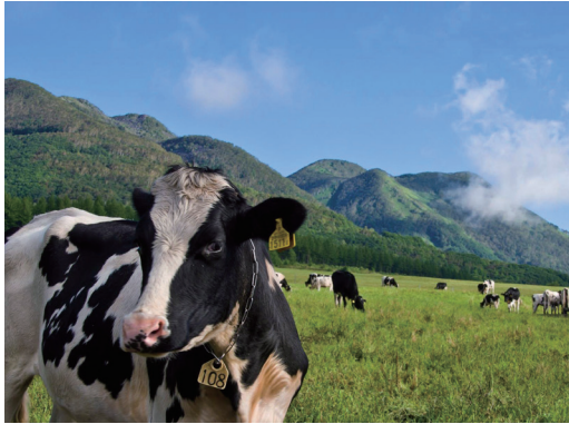
*写真は十勝管内士幌町