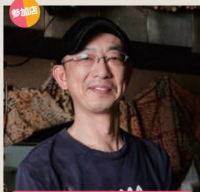
参加店 スープカレーカフェ SAMA 帯広店