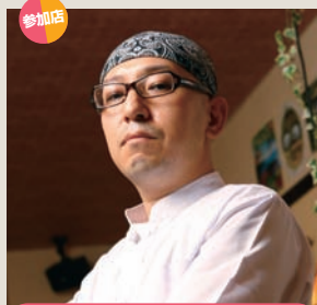
参加店 SONTOKU ソントク